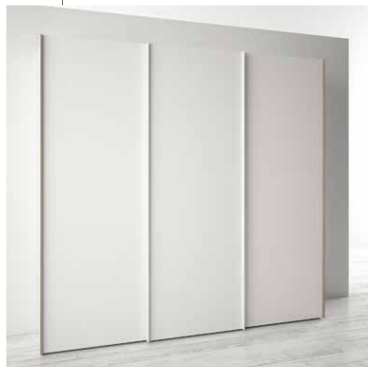
BIANCO maniglia CANAPA e BIANCO