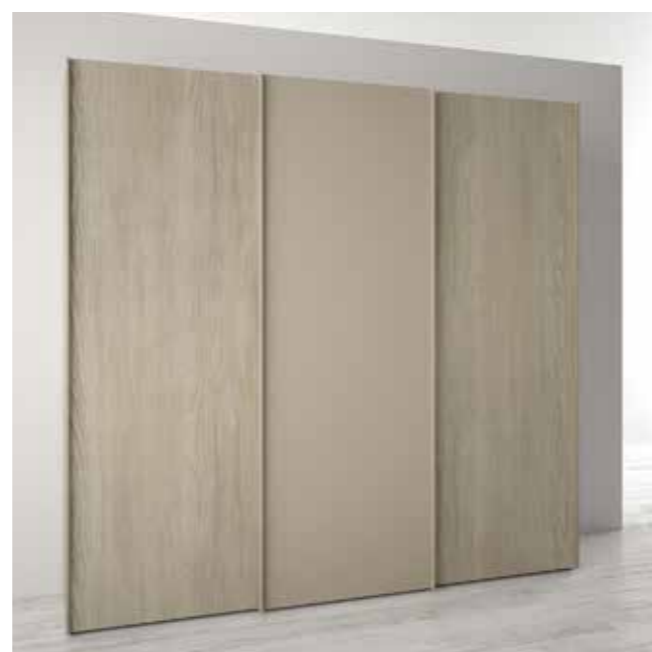
OLMO / CANAPA maniglia CANAPA