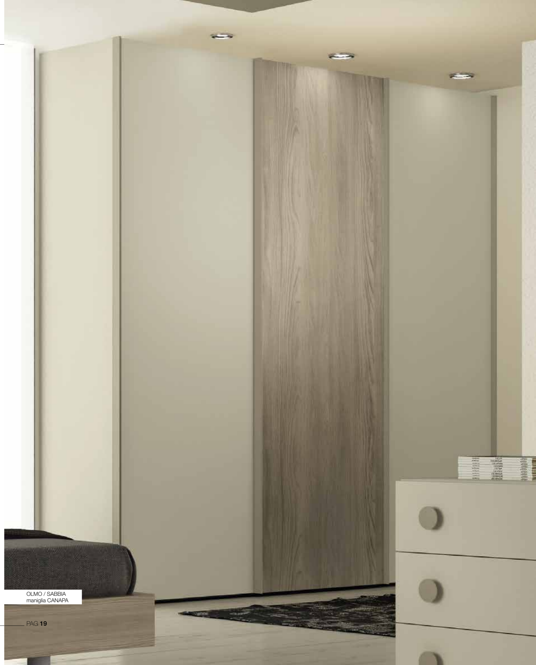
OLMO / SABBIA maniglia CANAPA