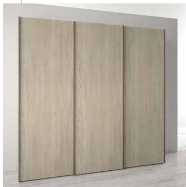
OLMO maniglia CANAPA

Cambiare la facciata del guardaroba scegliendo le nuances cromatiche più adeguate allo spazio che lo accoglie. Con gusto. Il vostro. Semplicemente possibile.