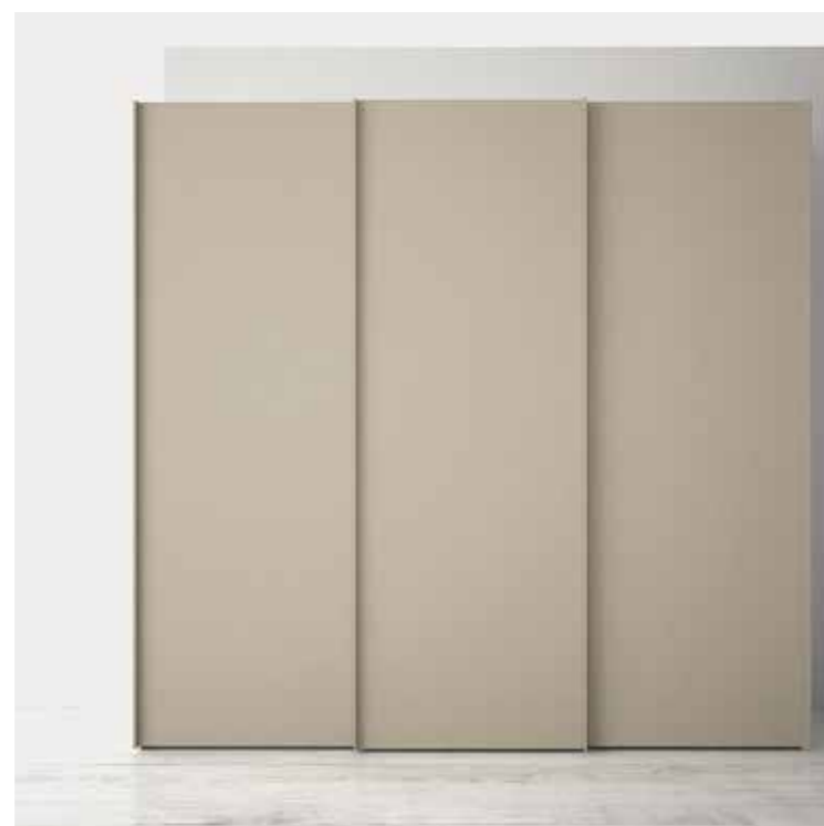
CANAPA maniglia CANAPA

Cambiare la facciata del guardaroba scegliendo le nuances cromatiche più adeguate allo spazio che lo accoglie. Con gusto. Il vostro. Semplicemente possibile.