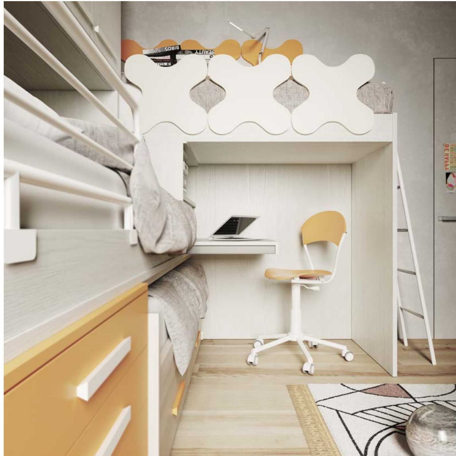
Sopra: dettaglio piano scrivania estraibile.